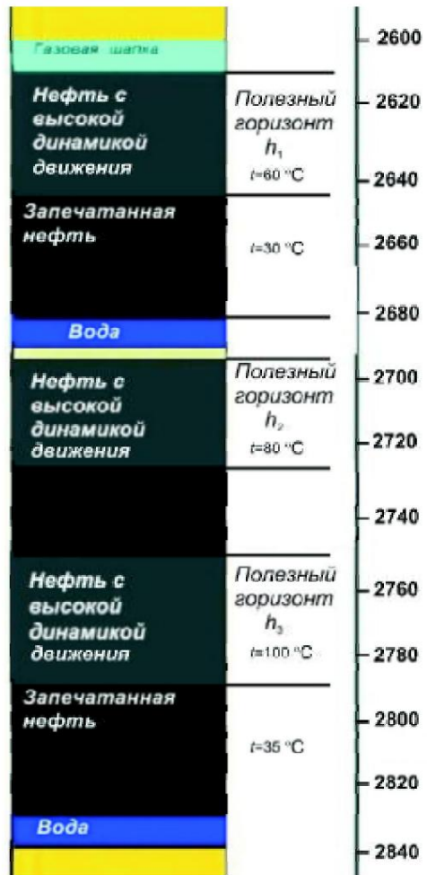
Res. 3. Góóágiäya kiökikka v öñ ÷ ää èçñä ðäñéý (øð. ðòäð, ÑØÀ). Beýleki parametrler \dot{I} = h_1 + h_2 + h_3 = 110 \text{ ð} ; manydaş 200 m

Dünyäniñ beýleki tarapynda-da şeýle we ş.m.